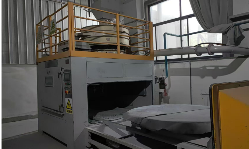
图二示意图：YQ-ZP1500-12A-9LT 喷砂机

3.涉事喷砂机生产工艺情况： 涉事设备为舱式内循环自动干喷砂机，适用于中间合金块状合金去除表面氧化皮、粘渣等。设备采用吸入式喷砂，即利用压缩空气在喷枪内高速流动形成负压产生的引射作用，将分砂斗的磨料通过喷砂管吸入喷枪内，然后随压缩空气由喷嘴高速喷出，实现对合金料块表面的喷砂处理。喷砂机主要由机器主机、工件旋转装置、喷枪及摆动机构、压缩空气系统、电器系统、行车台车、除尘器组成。喷砂时，人工将合金料块摆放在台车转盘上，然后启动台车进入喷砂舱到位，启动转盘旋转，当工件在转动时，12支往复摆动的喷枪自动对其进行喷砂，喷砂时间结束，自动吹尘枪自动清理合金表面散落的砂料，退出台车，由工人将合金块取出，再放上合金块即可。